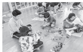
放課後児童クラブ