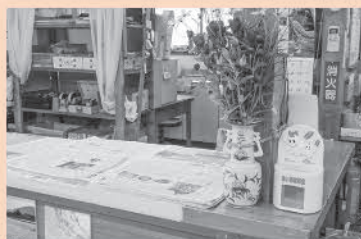
山 彩 村