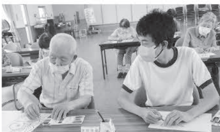
なぎみ苑(なぎみ健幸クラブ)