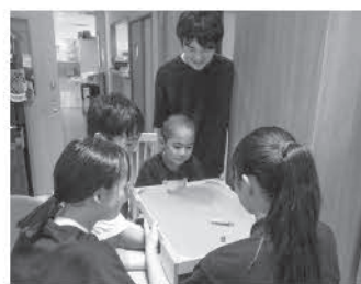
チャイルドホーム